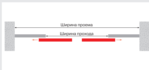
План (двухстворчатая дверь с неподвижными створками)